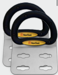
2x NorDan Grip